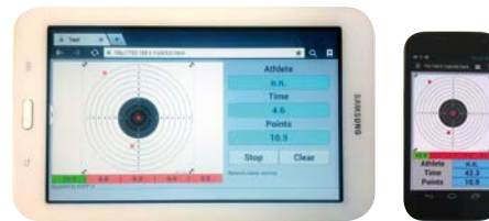
PreciShot-Software für Tablet und Smartphone.