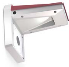
Beleuchtung für Nacht-Wettkämpfe.