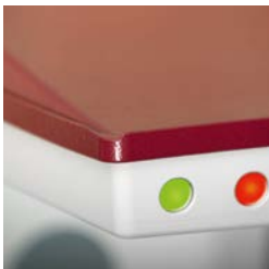
Sonnen- und Regenschutz-System.