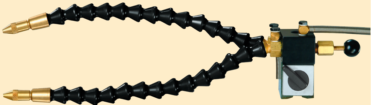
J2112 wie J1112, aber doppelt Sprüh-System

Ein System besteht aus den folgenden Basiselementen: Ein Steuerventil, einem Sprüh-System mit einem hochwertigen LOC-LINE Schlauch, einer Druckleitung, einer Saugleitung für Kühlmittel und einem Starken Ein/Ausschaltbaren Magneten. Der Magnet hat eine "V" - förmige Basis, welche es ermöglicht, ihn auch an unebenen Stellen zu befestigen.