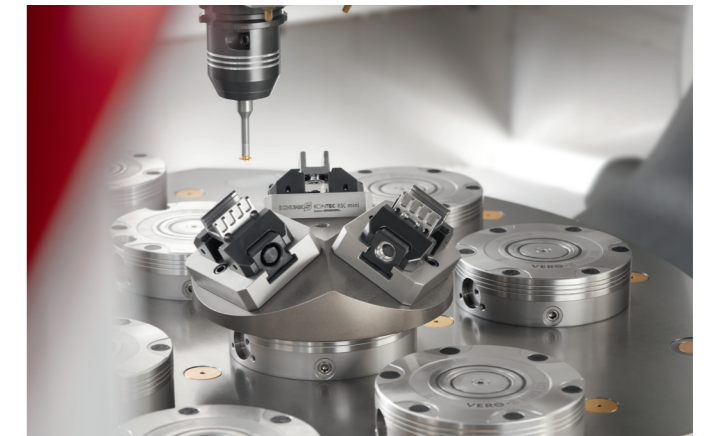
Einbringung von Nuten mit dem TENDO E compact